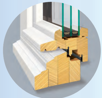
Wasserschenkel auf Flügel und Blendrahmen